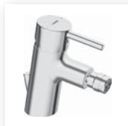
HANSAVANTIS STYLE Einhand-Einlochbatterie für Sitzwaschbecken, DN 15 5243 3277 verchromt Ablaufgarnitur (Metall), Anschluss über flexible Druckschläuche G 3/8 Ausladung: 107 mm HANSAVANTIS 5243 3273 verchromt