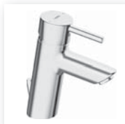
HANSAVANTIS STYLE XL Waschtisch-Einhand-Einlochbatterie, DN 15 5256 2277 verchromt Ablaufgarnitur (Metall), Anschluss über flexible Druckschläuche G 3/8 Ausladung: 104 mm HANSAVANTIS STYLE XL 5238 1177 verchromt für offene Heißwasserbereiter