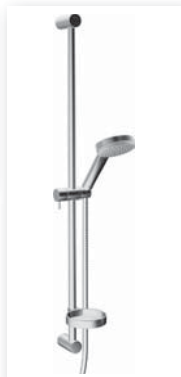
HANSAVIVA Wandstangen-Set 900 mm 4415 0130 verchromt HANSAVIVA Handbrause 3-strahlig, Ø 100 mm, Brauseschlauch 1750 mm