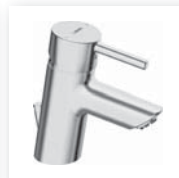
HANSAVANTIS STYLE Waschtisch-Einhand-Einlochbatterie, DN 15 für offene Heißwasserbereiter 5246 1177 verchromt Ablaufgarnitur (Metall), Anschluss über Kupferrohre Ausladung: 102 mm HANSAVANTIS 5246 1173 verchromt