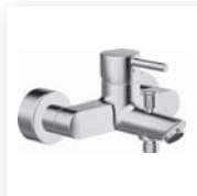
HANSAVANTIS STYLE Einhand-Wannen-Batterie, DN 15 (G 1/2) für Wandaufbau 5244 2177 verchromt Ausladung: 159 mm HANSAVANTIS 5244 2173 verchromt