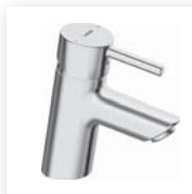
HANSAVANTIS STYLE Waschtisch-Einhand-Einlochbatterie, DN 15 5242 2277 verchromt ohne Ablaufgarnitur, Anschluss über flexible Druckschläuche G 3/8 Ausladung: 102 mm HANSAVANTIS 5242 2273 verchromt