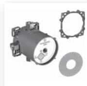
HANSAVAROX Grundeinheit, Kompakt-Lösung, DN 15 Unterputz-Einbaukörper 4000 0000 ohne Vorabsperrung 4001 0000 mit Vorabsperrung