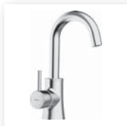
HANSAVANTIS STYLE Waschtisch-Einhand-Einlochbatterie, DN 15 5254 2277 verchromt Ablaufgarnitur (Metall), Anschluss über flexible Druckschläuche G 3/8 Ausladung: 134 mm