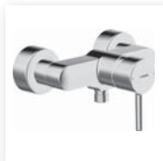
HANSAVANTIS STYLE Einhand-Brause-Batterie, DN 15 (G 1/2) für Wandaufbau 5245 0177 verchromt HANSAVANTIS 5245 0173 verchromt