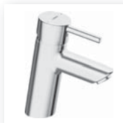
HANSAVANTIS STYLE XL Waschtisch-Einhand-Einlochbatterie, DN 15 5237 2277 verchromt ohne Ablaufgarnitur, Anschluss über flexible Druckschläuche G 3/8 Ausladung: 104 mm