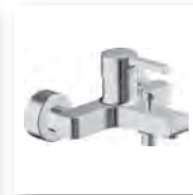
HANSAFORM Einhand-Wannen-Batterie, DN 15 (G 1/2) 4974 2103 verchromt Ausladung: 159 mm