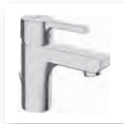
HANSAFORM Waschtisch-Einhand-Einlochbatterie, DN 15 4909 2103 verchromt Ablaufgarnitur (Metall), Anschluss über Kupferrohre Ausladung: 99 mm