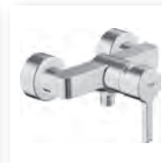
HANSAFORM Einhand-Brause-Batterie, DN 15 (G 1/2) 4967 0103 verchromt