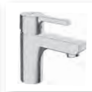
HANSAFORM Waschtisch-Einhand-Einlochbatterie, DN 15 4905 2203 verchromt ohne Ablaufgarnitur, Anschluss über flexible Druckschläuche G 3/8 Ausladung: 99 mm