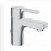
HANSAFORM Waschtisch-Einhand-Einlochbatterie, DN 15 für offene Heißwasserbereiter 4913 1103 verchromt Ablaufgarnitur (Metall), Anschluss über Kupferrohre Ausladung: 99 mm