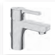
HANSAFORM Waschtisch-Einhand-Einlochbatterie, DN 15 4909 2203 verchromt Ablaufgarnitur (Metall), Anschluss über flexible Druckschläuche G 3/8 Ausladung: 99 mm