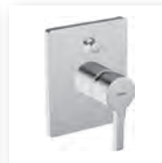
HANSAVAROX Funktionseinheit mit Dekorset zu HANSAFORM-Einhand-Wannen-Batterie 4992 9003 verchromt 4992 3003 verchromt mit Sicherungseinrichtung zzgl. HANSAVAROX UP-Grundeinheit