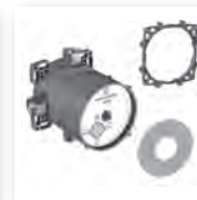
HANSAVAROX Grundeinheit, Kompakt-Lösung, DN 15 Unterputz-Einbaueinheit 4000 0000 ohne Vorabsperrung 4001 0000 mit Vorabsperrung