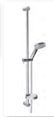
HANSAVIVA Wandstangen-Set 900 mm 4415 0130 verchromt HANSAVIVA Handbrause 3-strahlig, Ø 100 mm, Brauseschlauch 1750 mm