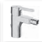
HANSAFORM Einhand-Einlochbatterie, DN 15 für Sitzwaschbecken 4906 3203 verchromt Ablaufgarnitur (Metall), Anschluss über flexible Druckschläuche G 3/8 Ausladung: 106 mm