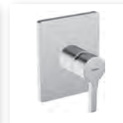
HANSAVAROX Funktionseinheit mit Dekorset zu HANSAFORM-Einhand-Brause-Batterie 4993 9003 verchromt