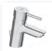
HANSAVANTIS STYLE Waschtisch-Einhand- Einlochbatterie, DN 15 für offene Heißwasserbereiter 5246 1177 verchromt # Ablaufgarnitur (Metall), Anschluss über Kupferrohre Ausladung: 102 mm HANSAVANTIS 5246 1173 verchromt