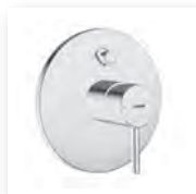
HANSAVAROX Funktionseinheit mit Dekorset zu HANSAVANTIS STYLE Einhand-Wannen-Batterie 4260 9077 verchromt 4260 3077 verchromt Mit Sicherungseinrichtung HANSAVANTIS 4260 9073 verchromt zzgl. HANSAVAROX UP-Grundeinheit