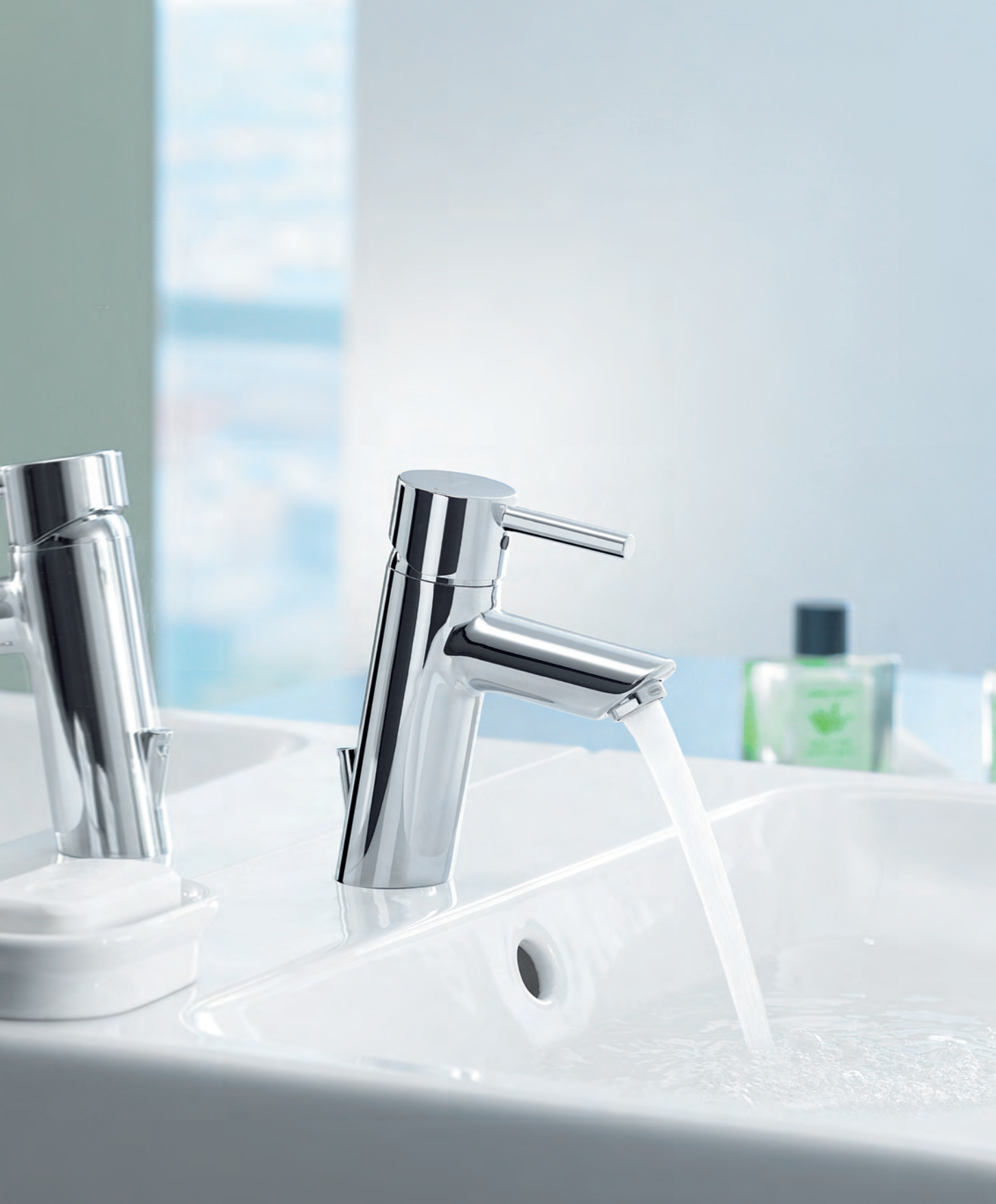
HANSAVANTIS STYLE XL mit Pin-Bedienungshebel. Der Name ist Programm, denn die „XL“ ist rund 20 mm höher als die ganz rechts abgebildete Basisversion.