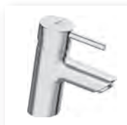
HANSAVANTIS STYLE Waschtisch-Einhand- Einlochbatterie, DN 15 5242 2277 verchromt ohne Ablaufgarnitur, Anschluss über flexible Druckschläuche G 3/8 Ausladung: 102 mm HANSAVANTIS 5242 2273 verchromt