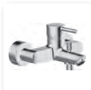
HANSAVANTIS STYLE Einhand-Wannen-Batterie, DN 15 (G 1/2) für Wandaufbau 5244 2177 verchromt Ausladung: 159 mm HANSAVANTIS 5244 2173 verchromt