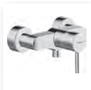
HANSAVANTIS STYLE Einhand-Brause-Batterie, DN 15 (G 1/2) für Wandaufbau 5245 0177 verchromt HANSAVANTIS 5245 0173 verchromt