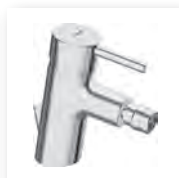
HANSAVANTIS STYLE Einhand-Einlochbatterie für Sitzwaschbecken, DN 15 5243 3277 verchromt Ablaufgarnitur (Metall), Anschluss über flexible Druckschläuche G 3/8 Ausladung: 107 mm HANSAVANTIS 5243 3273 verchromt