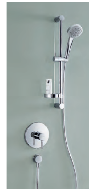
Formal auf HANSAVANTIS abgestimmt ist das HANSAVIVA Wandstangenset – 3strahlige Handbrause, 175 cm langer Brausenschlauch und Wandstange. Alles aus einem optischen Guss.

Für die „Krönung“ von Duschen und Wannen bietet HANSAVANTIS verschiedene Armaturen, sowohl für die Aufputz-Installation als auch für die Unterputz-Installation. Die Armaturen für beide Installationsvarianten sind sowohl mit dem schlanken Pin-Bedienungshebel als auch mit dem ergonomisch flachen Vollhebel erhältlich. Es ist doch schön, eine Auswahl zu haben, ohne Kompromisse eingehen zu müssen. Denn HANSAVANTIS überzeugt auch mit inneren Werten. Die hohe Materialgüte kann man sehen und fühlen. Die leichtgängige Bedienung ist ein sicheres Zeichen für beste handwerkliche Qualität. Die integrierte Heisswassersperre ist ein wichtiges Detail, vor allem, wenn Kinder im Haus sind. Die hochwertige Verarbeitung geht Hand in Hand mit ausgezeichneter Montagefreundlichkeit. Ob für den Waschtisch, die Badewanne oder die Dusche, ob als Aufputz- oder Unterputzlösung: bei HANSAVANTIS passt einfach alles.