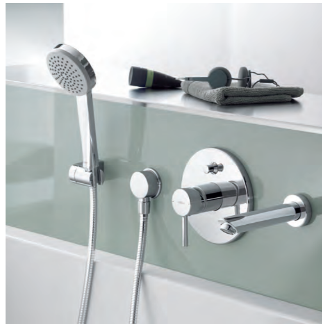
Elegante Unterputzvariante, HANSAVAROX Funktionseinheit mit Dekorset HANSAVANTIS und Pin-Bedienungshebel, separatem Wanneneinlauf sowie dem HANSAVIVA Wannenset. Ebenso komfortabel ist die Wannenlösung mit ergonomisch flachem Vollhebel (Abb. unten).