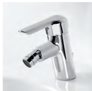
HANSAVANTIS Armatur mit ergonomisch flachem Vollhebel, speziell fürs Bidet.