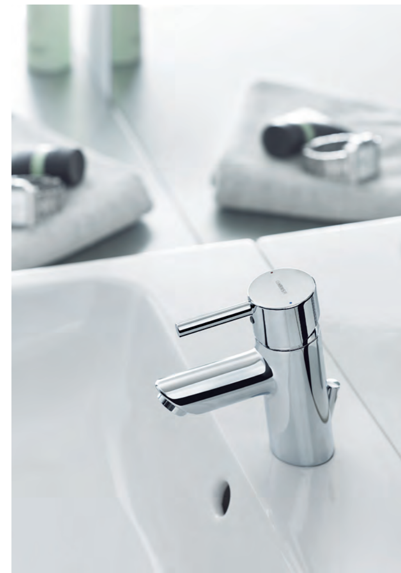
HANSAVANTIS STYLE als Designvariante mit bogenförmigem Auslauf und seitlichem Pin-Bedienungshebel (Abb. unten).