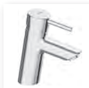
HANSAVANTIS STYLE XL Waschtisch-Einhand- Einlochbatterie, DN 15 5237 2277 verchromt ohne Ablaufgarnitur, Anschluss über flexible Druckschläuche G 3/8 Ausladung: 104 mm