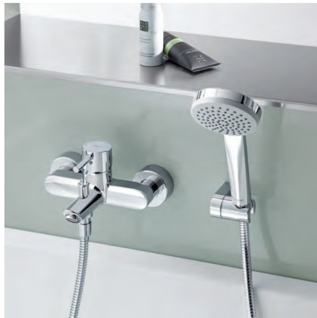
HANSAVANTIS Wannenarmatur mit Pin-Bedienungshebel und HANSAVIVA-Set als Aufputzlösung (Abb. oben). Unten abgebildet als gleichwertige Alternative mit ergonomisch flachem Vollhebel.