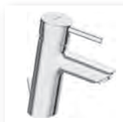
HANSAVANTIS STYLE XL Waschtisch-Einhand- Einlochbatterie, DN 15 5256 2277 verchromt Ablaufgarnitur (Metall), Anschluss über flexible Druckschläuche G 3/8 Ausladung: 104 mm HANSAVANTIS STYLE XL 5238 1177 verchromt # für offene Heißwasserbereiter