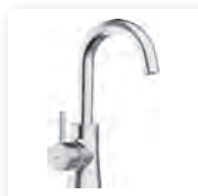
HANSAVANTIS STYLE Waschtisch-Einhand- Einlochbatterie, DN 15 5254 2277 verchromt Ablaufgarnitur (Metall), Anschluss über flexible Druckschläuche G 3/8 Ausladung: 134 mm