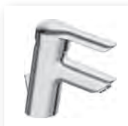
HANSAVANTIS* Waschtisch-Einhand- Einlochbatterie, DN 15 5240 2273 verchromt Ablaufgarnitur (Metall), Anschluss über flexible Druckschläuche G 3/8 Ausladung: 102 mm HANSAVANTIS STYLE 5240 2277 verchromt