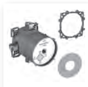
HANSAVAROX Grundeinheit, Kompakt- Lösung, DN 15 Unterputz-Einbaukörper 4000 0000 ohne Vorabspernung 4001 0000 mit Vorabspernung