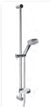
HANSAVIVA Wandstangen-Set 900 mm 4415 0130 verchromt HANSAVIVA Handbrause 3-strahlig, Ø 100 mm, Brauseschlauch 1750 mm