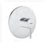
HANSAVAROX Funktionseinheit mit Dekorset zu HANSAVANTIS STYLE Einhand-Brause-Batterie 4261 9077 verchromt HANSAVANTIS 4261 9073 verchromt