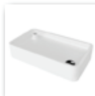
HANSA DESIGNO Top Waschtisch* 5172 1000 alpinweiß 600x340x125 mm