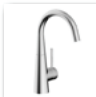
HANSA DESIGNO Armatur 5149 2173