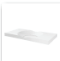
HANSA MURANO Waschtisch* 5608 1000 alpinweiß 900x450x60 mm