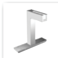
HANSA CANYON Armatur 0761 2201