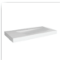
HANSA LATRAVA Waschtisch* 0747 1000 alpinweiß 900x450x70 mm