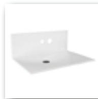
HANSA DESIGNO Wand Waschtisch 5109 1000 alpinweiß 670x425x325 mm zzgl. 5109 1200 Konsolen