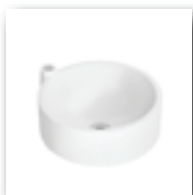
HANSA DESIGNO Side Waschtisch* 5149 1000 alpinweiß D= 372x145/185 mm