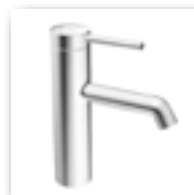
HANSA DESIGNO Armatur 5172 2173

*Aufsatz-Waschtische; Wandlösungen auf Nachfrage über HANSA SERVICEplus