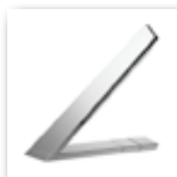
HANSA LATRAVA Armatur 0747 2201