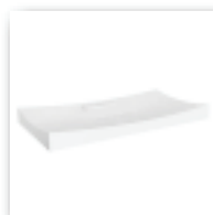
HANSA CANYON Waschtisch* 0761 1000 alpinweiß 900x450x80 mm